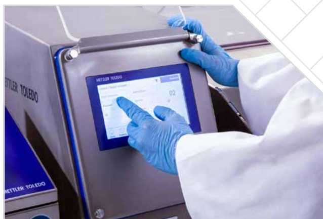
ИНСПЕКЦИЯ СРЕЩУ МЕТАЛНИ ЗАМЪРСИТЕЛИ стр. 1