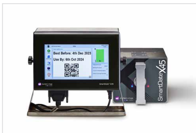
ТЕРМОТРАНСФЕРНИ ПРИНТЕРИ ЗА ПЕЧАТ ВЪРХУ ФОЛИО стр. 3