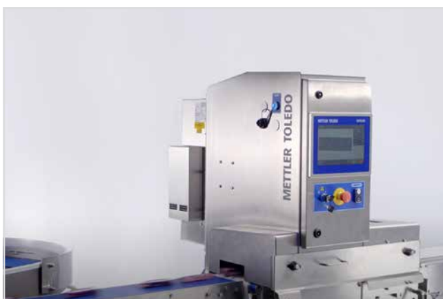
X-RAY СКЕНЕРИ СРЕЩУ ОПАСНИ ЗАМЪРСИТЕЛИ стр. 2