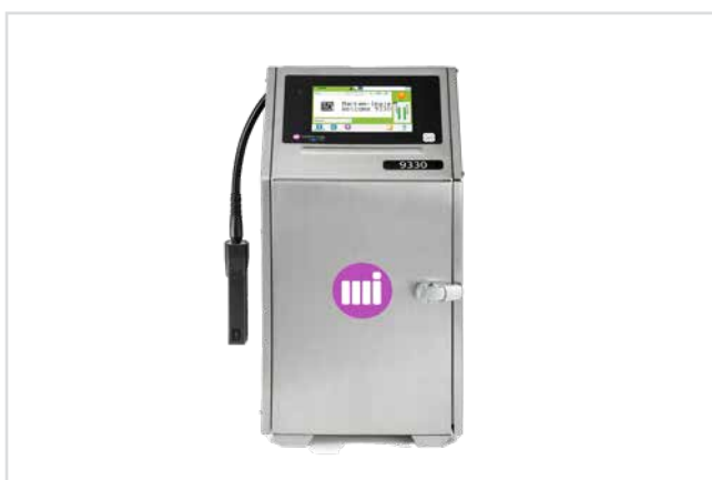
МАСТИЛЕНОСТРУЙНИ ПРИНТЕРИ С РАЗЛИЧНИ ПРИЛОЖЕНИЯ стр. 4