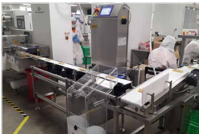
КОНТРОЛ НА ТЕГЛОТО НА ПРОДУКТИТЕ стр. 1