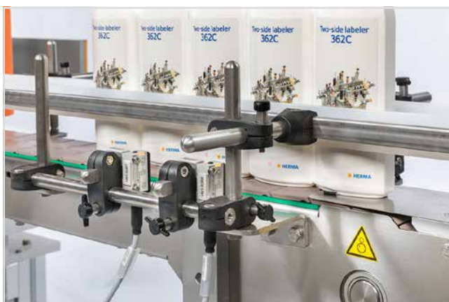
АВТОМАТИЧНИ ЕТИКЕТИРАЩИ МАШИНИ стр. 3