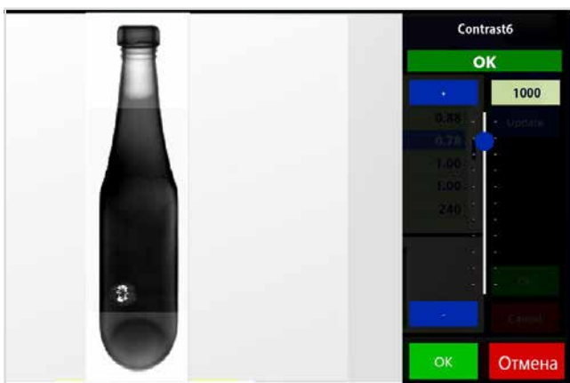
X-RAY СКЕНЕРИ стр. 4