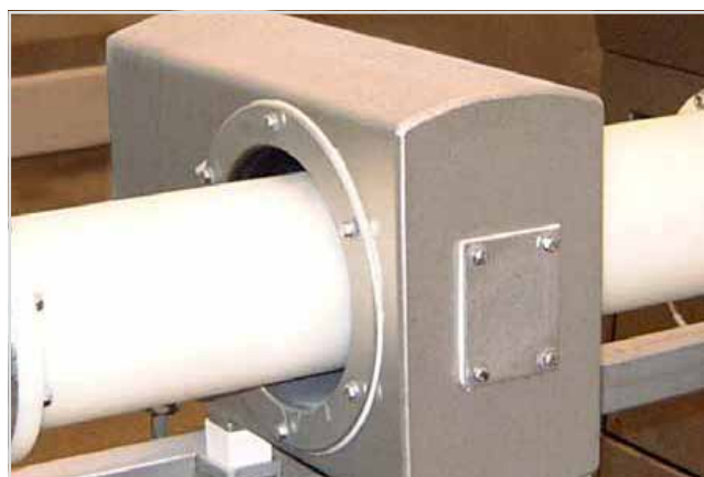
МЕТАЛДЕТЕКТОРИ PIPELINE PROFILE стр. 4