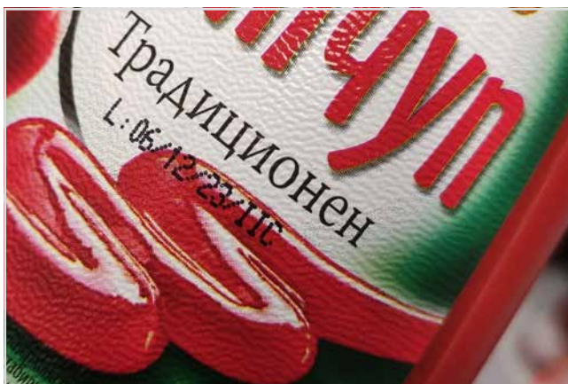
КОДИРАНЕ НА ОПАКОВКИ ЗА ПАСТООБРАЗНИ ПРОДУКТИ стр. 1