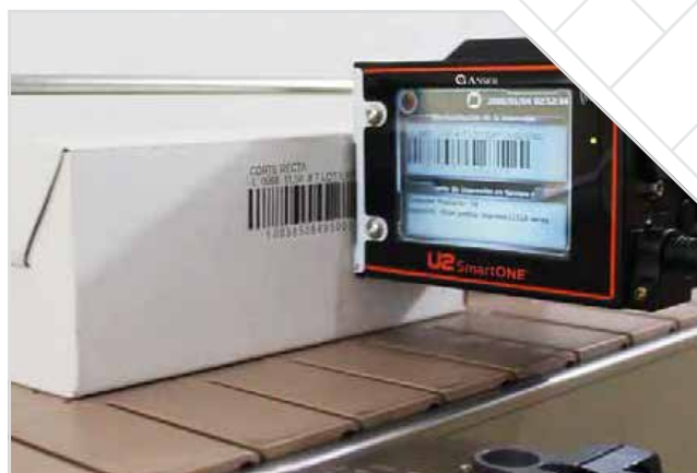
КОДИРАНЕ И ЕТИКЕТИРАНЕ НА ТАРЕЛКИ, КАШОНИ И СТЕКОВЕ стр. 2